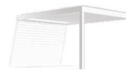
PERGOLA ADOSSÉE AU MUR